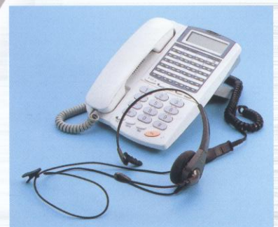
<ヘッドセット接続用ジャック付電話機> IP-24N-CT002C