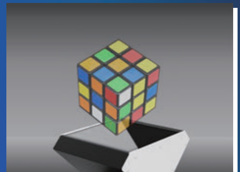
● 浮遊・非接触によるゲームに