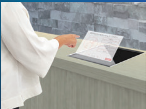
● ビル・オフィスのエントランスに