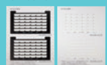
IP-36N-ST101C(B) 用示名条シート / (B) 用示名条シート (10枚1組)

※ ラインキー着信、マルチライン着信、バーチャルライン着信の通話チャンネル数は合わせて 24 です。