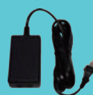
IP-TEL AC アダプタ B(S)N-2