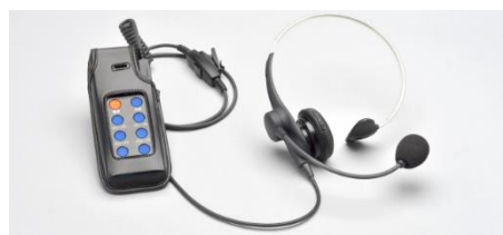
双方向同時通話可能なインカムシステム (株式会社ティビーアイ製)