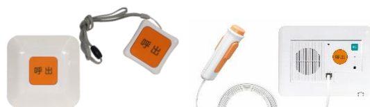
緊急呼出コールシステム