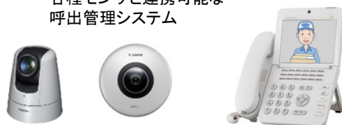
監視カメラシステム

*ネットワークカメラは、Canon製、Panasonic製、その他各種機種が 接続可能です。詳細はお問い合わせください。