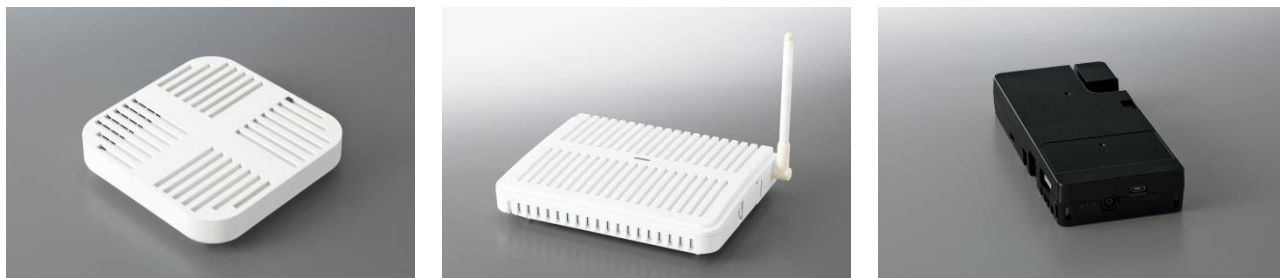
左から「NYC-EDGE-L (NYC-EDGE-3)」、 「NTLoRa-GW」※4 「NTLoRa-WMIF」※4